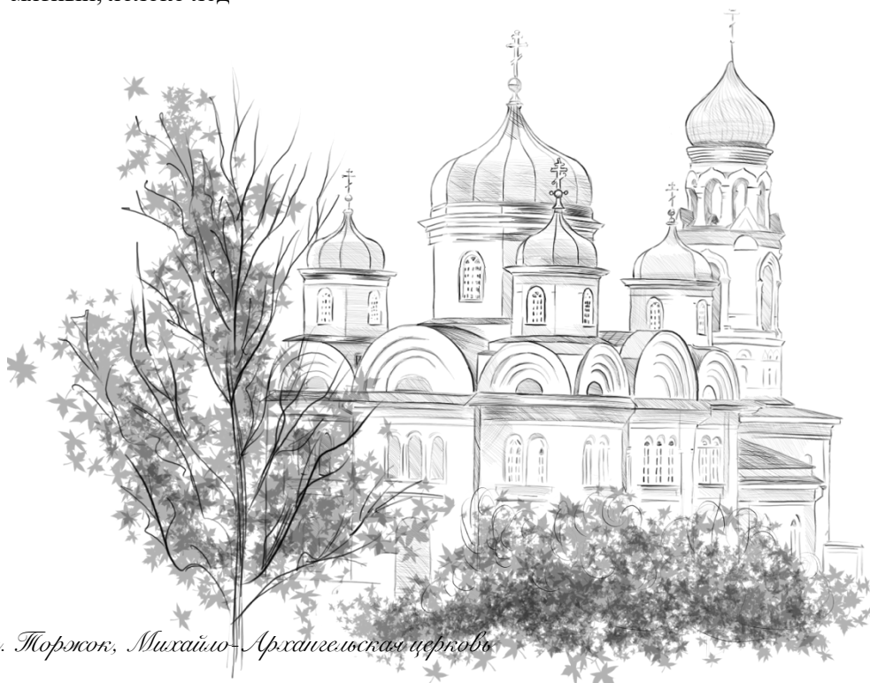
г. Торжок, Михайло-Архангельская церковь